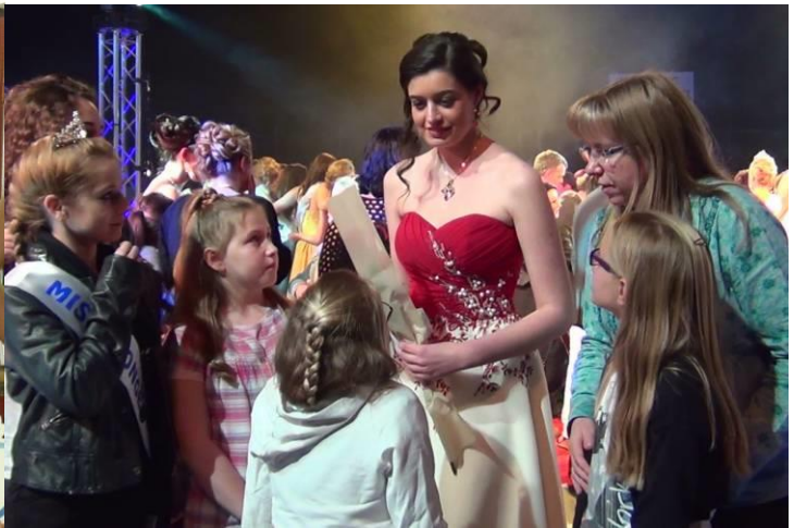
Election Miss Oise 2014 Méghanne et une partie de ses fans...

Vous pouvez suivre notre actualité sur notre page FACEBOOK et nos vidéos sur www.dailymotion.com ou www.youtube.com