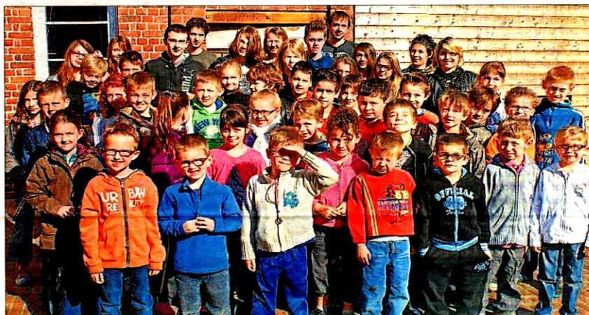
Plus de quarante enfants et adolescents pour le stage de Pâques de l'Emion.

Le stage de deux jours de l'École de musique Emion a une fois encore fait le plein mardi et mercredi avec son concept de « musique plaisir ».