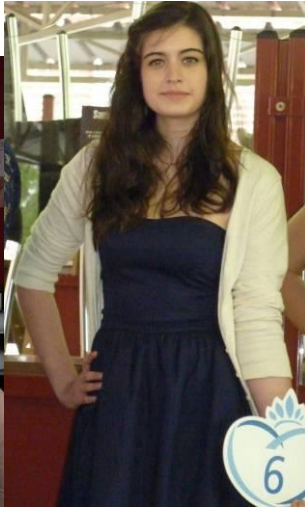
Conférence de Presse du 23 avril